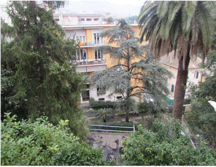
Vista dal balcone