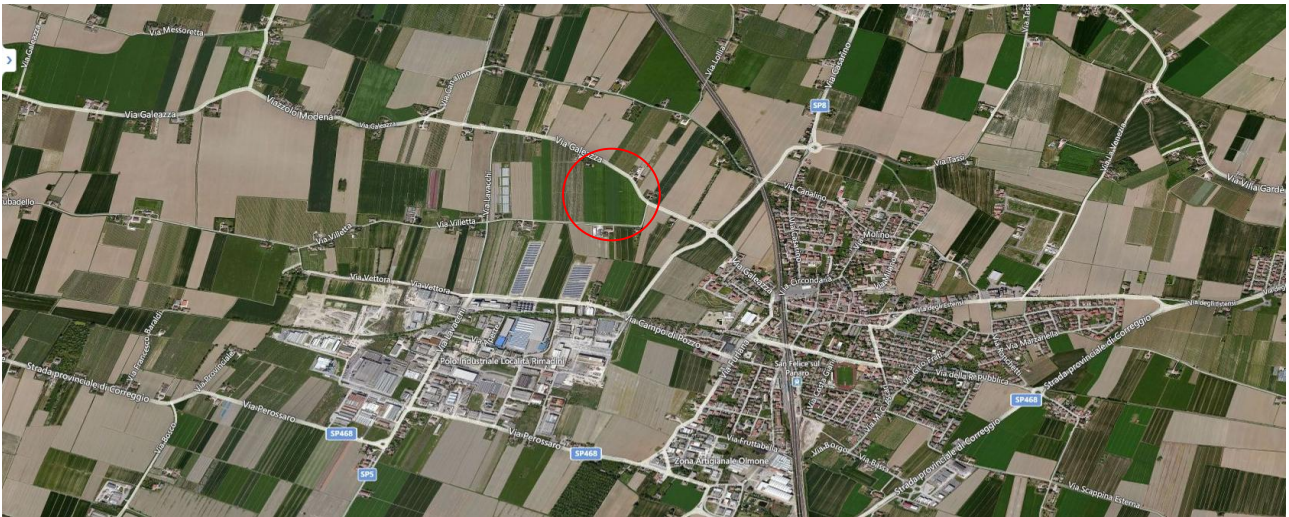
San Felice sul Panaro, evidenziato il terreno di Proprietà dell'Università di Genova